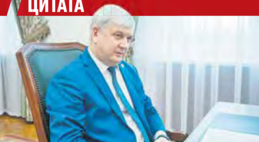
Александр ГУСЕВ, губернатор Воронежской области:

«Один из частых вопросов, который слышу от краеведов, — что будет со зданием Дома офицеров (а когда-то — Мариинской гимназией). Сейчас в этом историческом здании в центре Воронежа находится областной Дом молодежи, но скоро он переедет в административное здание на улице Плехановской. Мы провели переговоры с Министерством обороны и теперь вместе с военным ведомством планируем перепрофилировать Дом офицеров в Центр военно-патриотического воспитания. Детали еще предстоит проработать: необходимо тщательное планирование использования пространства. Но главное — площадка Дома офицеров по-прежнему будет использоваться для развития детей и молодежи. // В ОФИЦИАЛЬНОМ ТЕЛЕГРАМ-КАНАЛЕ ГУБЕРНАТОРА»