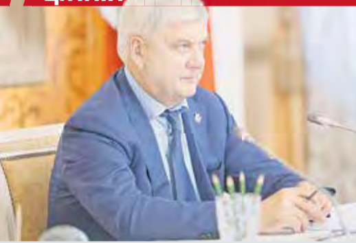
Александр ГУСЕВ , губернатор Воронежской области:

«Уже думаем, что пойдет в новый репроект нацпроекта «Семья». На оперативном совещании обсудили заботу о старшем поколении. По моему поручению еще в 2019 году стали внедрять систему долгосрочного ухода (СДУ) за гражданами пожилого возраста и инвалидами. С 2020 года проект стал пилотным в некоторых районах региона, а в прошлом году — начали реализовывать его на территории всей области. На создание СДУ в рамках репроекта «Старшее поколение» нацпроекта «Демография» направили 235 млн рублей. Поручил коллегам отметить все положительные наработки и включить лучшие практики в репроект нового нацпроекта «Семья». // В ОФИЦИАЛЬНОМ ТЕЛЕГРАМ-КАНАЛЕ ГУБЕРНАТОРА