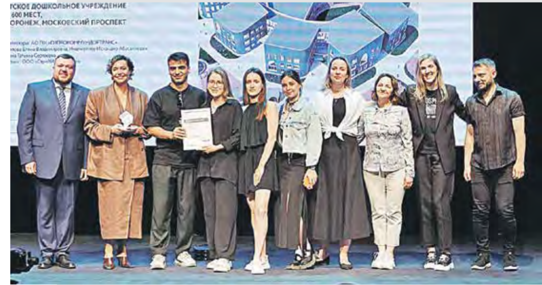
подготовили: Алина ЕГОРОВА, Анастасия САРМА // Михаил КИРЬЯНОВ, lme/zodchestvovrn

Гран-при получили: ✓ в направлении «Постройки» — ООО «М4» (Москва) — проект «Благоустройство Советской площади в Ялте»; ✓ в направлении «Проекты» — АО «Проектный институт «Гипрокоммундортранс» (Воронеж) — проект «Детское дошкольное учреждение на 600 мест, Воронеж, Московский проспект». Кроме того, были определены специальные дипломы конкурсной программы и специальные дипломы Союза архитекторов России, которыми отмечаются сильные профессиональные решения среди заявленных работ.