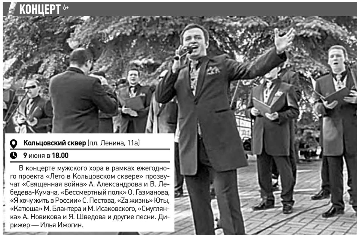
Концерт в Кольцовском сквере