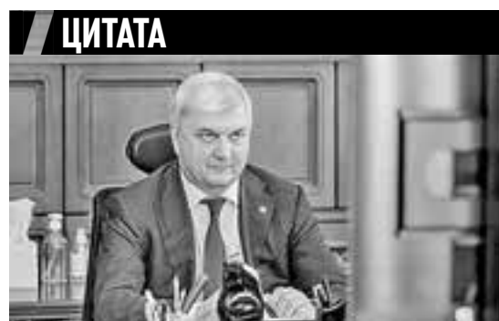
Александр ГУСЕВ, губернатор Воронежской области

У нас снизилось общее количество болеющих ковидом и ОРВИ практически на 10 % по отношению к пику: было 66 тыс. человек, а сейчас — около 60 тыс. болеющих. Уверен, что это не временный факт, а тенденция. Мы видим, как ситуация в Москве и в России разворачивается. Поэтому считаю, что пик заболеваемости мы прошли, как и прогнозировали. Если снижение продолжится, мы со следующей недели начнем снимать ограничения. В том числе, я считаю, возможна отмена QR-кодов. // НА ЗАСЕДАНИИ ОПЕРАТИВНОГО ШТАБА ПО БОРЬБЕ С КОРОНАВИРУСОМ