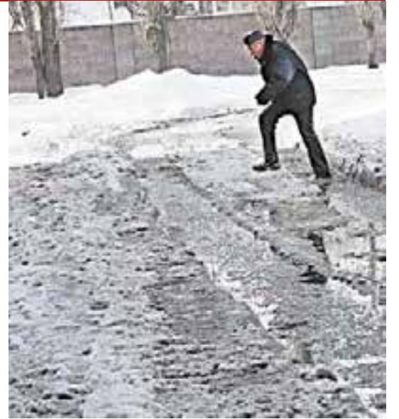
ПОДГОТОВИЛА Виктория ВОРОФЛОМЕЕВА // РИА «Воронеж» (ФОТО)

Что касается уходящей зимы, то Воронежская область в три раза перевыполнила норму по количеству осадков, особенно в некоторых районах.