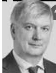
Александр ГУСЕВ, губернатор Воронежской области