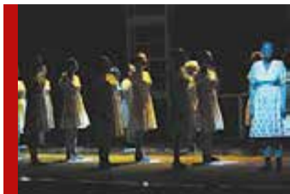
Театр драмы: документальное кино и рассказы для детей

Воронежские театры, закрытые на время режима самоизоляции, подготовили ряд бесплатных онлайн-мероприятий ко Дню Победы. Среди них — спектакли онлайн, чтения фронтовых писем, песни военных лет и воспоминания о воевавших родственниках. «Семёрочка» публикует обзор всех проектов в Сети.