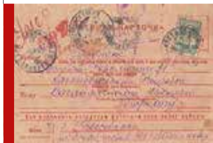
Театр юного зрителя: письма

Артисты ТЮЗа запустили в интернете флешмоб «История Победы». Всем желающим предлагают выложить в соцсети фото воевавшего родственника и написать историю о нем, снабдив пост хештегом #победа75тюзвн. Самые интересные истории опубликуют в группе ТЮЗа.