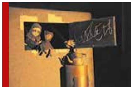
Оперный и кукольный: трансляции спектаклей

В рамках видеомарафона «Письма с фронта» актеры и работники театра будут читать письма солдат, но не только подлинные, но и художественное произведение — письмо из пьесы. Первый зритель, который найдет настоящую копию, получит приглашение на два места в театр.