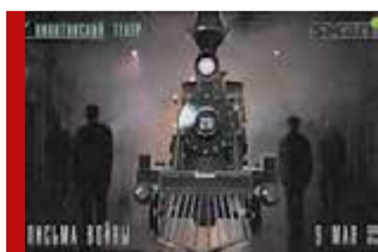
Никитинский театр: онлайн-премьера

Театр кукол «Шут» в честь праздника покажет онлайн свою недавнюю премьеру — спектакль на малышкиной сцене «Детский дневник войны». Постановку будут выдавать частями — первая уже опубликована в группе театра в соцсети. До 9 мая спектакль выложат полностью.