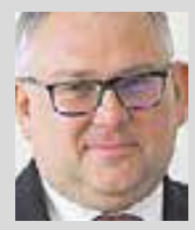
Олег МОСОЛОВ , глава департамента образования, науки и молодежной политики Воронежской области

— Планируется, что летом в Воронежской области будет работать 31 лагерь, в том числе 17 муниципальных. Восемь из них расположены в Воронеже, остальные — в Борисоглебском, Грибановском, Каменском, Новоусманском, Ольховатском, Павловском, Рамонском, Россошанском и Семилукском районах. Это загородные детские оздоровительные лагеря, летние трудовые отряды, стационарные, дневные, палаточные и передвижные лагеря, санатории.