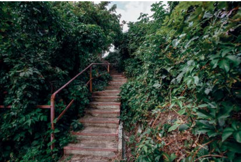
Улица Петра Сазонова

Сегодня слово «металлист» ассоциируется скорее с музыкальной субкультурой, хотя раньше в русском языке оно обозначало работника металлургической отрасли. Свое нынешнее название улица получила в 1928 году. На улице находилось жилищное товарищество «Металлист», в которое входили рабочие соответствующих профессий. До революции 1917 года эта улица называлась Соборная Гора, на ней располагался главный собор Воронежа — Благовещенский.