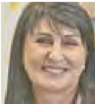
«7» У социальной няни есть график работы — с 8 до 19 часов, но при этом ее услуги можно воспользоваться и в выходные дни

В текущем учебном году в Воронежской области будут создаваться Центры психолого-педагогической, медицинской и социальной помощи. Они появятся в каждом районе. Центры будут поддерживать детей и их родителей. Вопрос обсуждался на заседании правительства Воронежской области 23 сентября.