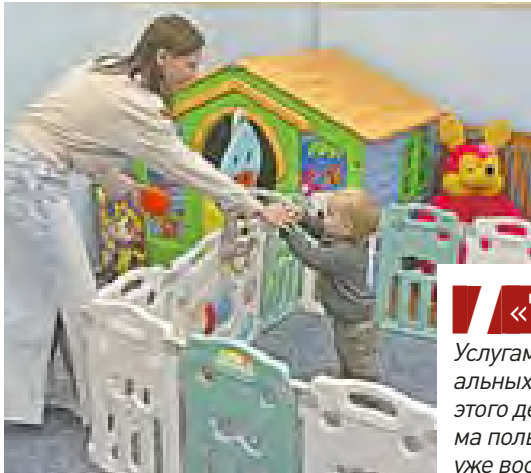
«7» Услугами социальных нянь от этого детского дома пользуются уже восемь семей

— Три раза няня приезжала к нам домой — так было удобнее, у Феи как раз по плану был дневной сон, — рассказывает Ирина. — А вот сегодня мы решили, что сами приедем к нашей няне, и, как я вижу, тут ему все нравится.