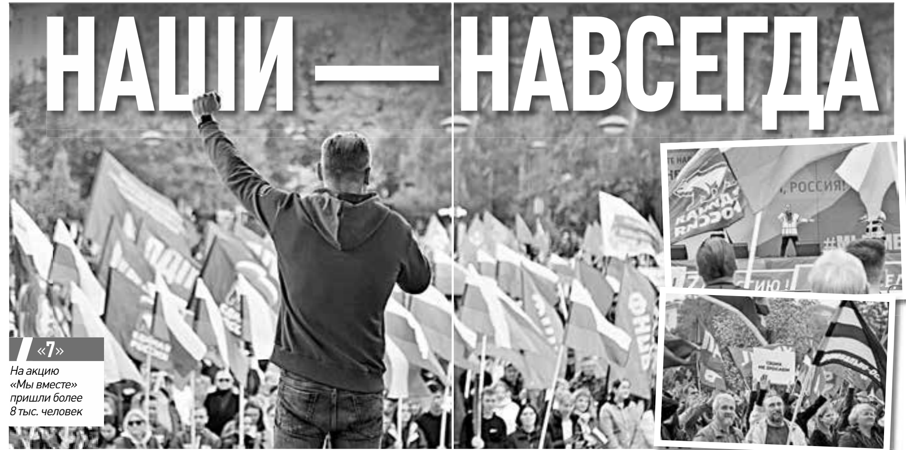
«7» На акцию «Мы вместе» пришли более 8 тыс. человек

ВОРОНЕЖЦЫ ПОДДЕРЖАЛИ ПРИСОЕДИНЕНИЕ ЛДНР, ХЕРСОНА И ЗАПОРОЖЬЯ К РОССИИ