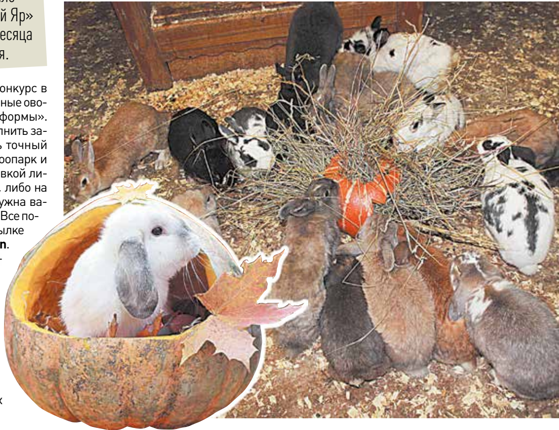
ПОДГОТОВИЛА Наталья СТАРОДУБЦЕВА // vk.com/zooparkvrn (ФОТО)

Редакция ждет ваших звонков, SMS и писем о проблемах, событиях и новостях. Телефон +7 (473) 277-66-98, e-mail: v-kurier7@mail.ru ИЩИТЕ НАС В СОЦСЕТЯХ: