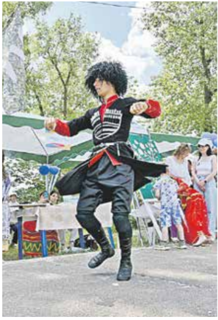
подготовили: Алина БЕЛАЯ