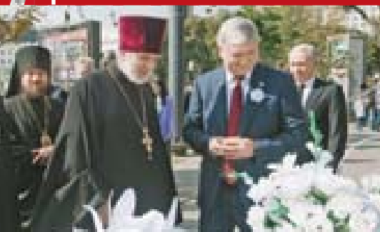
Александр ГУСЕВ, губернатор Воронежской области:

«Можно сказать, что у города два дня рождения: первый раз 437 лет назад, когда он был основан, а второй — после Великой Отечественной войны. Почти полностью разрушенный Воронеж за короткое время был восстановлен заботливыми руками своих жителей. Все вы знаете, что в этом году исполнилось 80 лет со дня освобождения города от немецко-фашистских захватчиков. Не побежденный и возрожденный Воронеж стал символом несгибаемой воли и бесконечной преданности горожан. Современные поколения воронежцев по завету предков тоже трепетно относятся к судьбе города. Он становится моложе и краше. // НА ТОРЖЕСТВЕННОЙ ЦЕРЕМОНИИ НАГРАЖДЕНИЯ ЖИТЕЛЕЙ ВОРОНЕЖА ПАМЯТНЫМИ ЗНАКАМИ