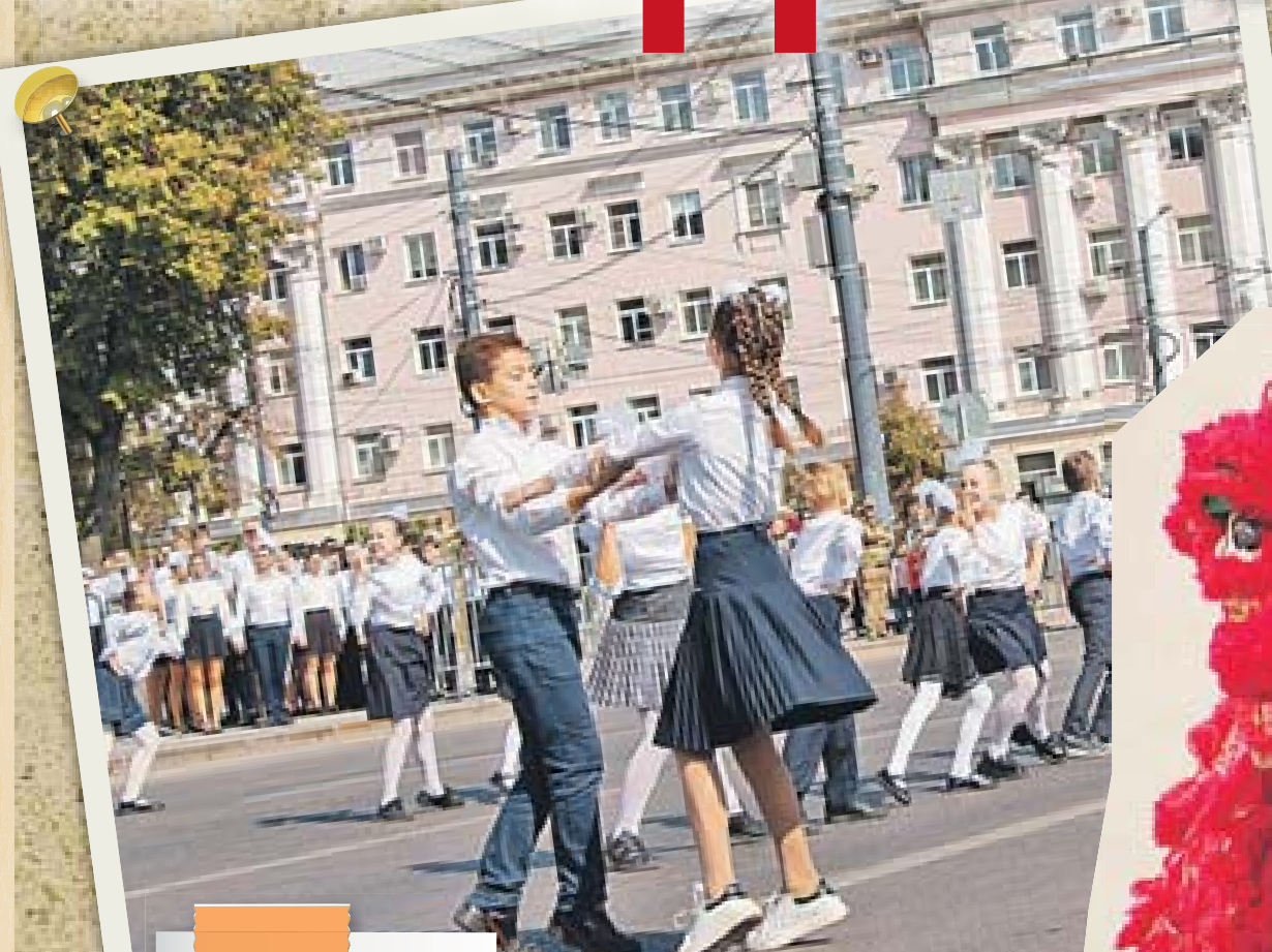
Школьный вальс на площади Ленина в исполнении воспитанников городских учреждений культуры и образования

В субботу, 16 сентября, Воронеж отметил свое 437-летие. Несмотря на то что праздник проходил в ограниченном формате с учетом соблюдения необходимых мер безопасности, в событиях приняло участие множество горожан и гостей города.