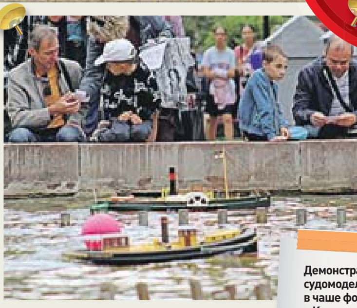
Демонстрация судомоделей в чаше фонтана в Кольцовском сквере