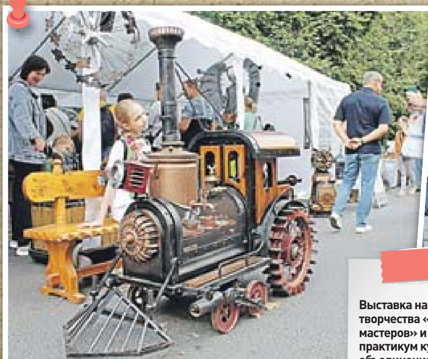
Выставка народного творчества «Город мастеров» и школа-практикум кузнечного объединения «Якорь»