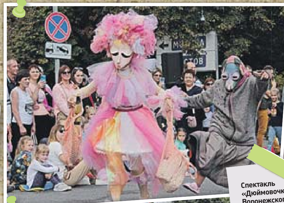
Спектакль «Дюймовочка» Воронежского театра кукол «Шут» рядом с Кольцовским сквером