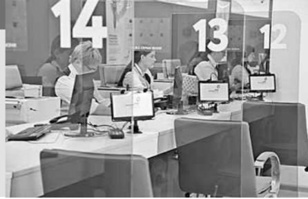
Подготовила Наталья СТАРОДУБЦЕВА // РИА «Воронеж» (ФОТО)

Правительство РФ дополнительно выделило Воронежской области более 132 млн рублей на поддержку семей с детьми в 2022 году.