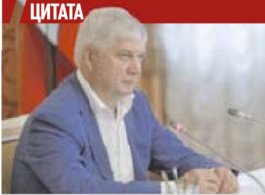
Александр ГУСЕВ, губернатор Воронежской области:

Вопросы, связанные с общественным транспортом, держу на личном контроле. В прошлом году направили из регионального бюджета 1,4 млрд рублей компенсационных выплат и лизинговых платежей транспортным компаниям. Развиваем и дорожную инфраструктуру. Уже изменили организацию дорожного движения и обустроили выделенные полосы для автобусов на Северном, Чернавском, Вогрэсовском мостах, на участке от улицы Остужева до Ленинского проспекта, на улице Плехановской и на Московском проспекте. Рассчитываем, что предстоящее расширение дорожной сети с организацией соответствующей инфраструктуры также положительно скажется на движении общественно-го транспорта. Будем развивать интеллектуальную транспортную систему, стремиться преодолеть дефицит водителей, работать над другими ключевыми проблемами. // ОФИЦИАЛЬНОМ ТЕЛЕГРАМ-КАНАЛЕ ГУБЕРНАТОРА