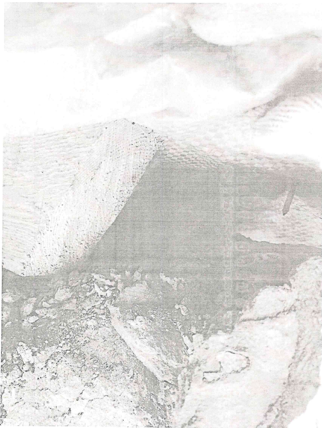
Фото №1. Примыкание стропильных ног к кирпичной кладке