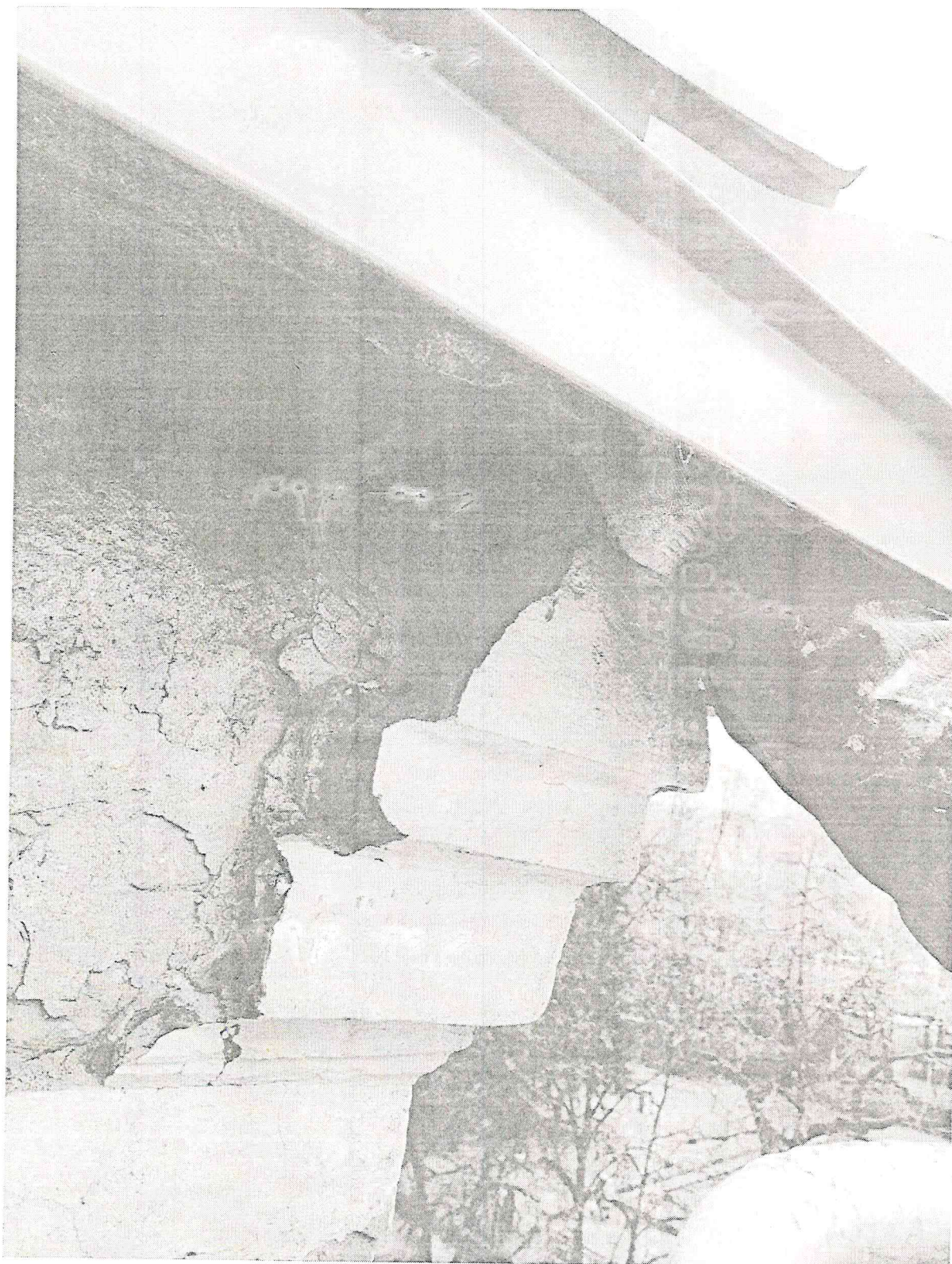
Фото №2. Примыкание стропильных ног к кирпичной кладке